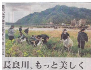
長良川、もっと美しく

送付しました第17回定時総会に代わる表決資料をご検討いただき、別紙書面表決書をご提出いただきますようお願い申し上げます。